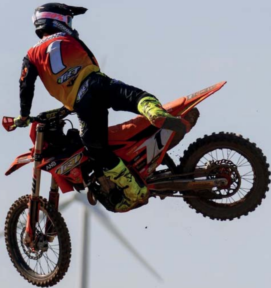
Imagen: Ivan Reina